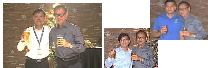
ទំនាក់ទំនងដ៏រឹងមាំរវាង BTEC និង PTEC

យើងបានចំណាយពេលវេលាសប្បាយជាច្រើនជាមួយគ្នាក្នុង ពិធីដប់លៀងនេះ។ BTEC PTEC និង គម្រោង SHCC បាន រៀបចំការសម្តែងជូនលោកនាយក ប៊ិន ធំ ដើម្បីអបអរសាទរ ការចូលនិវត្តន៍របស់គាត់។ យើងអាចពង្រឹងទំនាក់ទំនងមួយនេះមកទល់ពេលនេះ។ សូម ជួយសហការធ្វើឱ្យ SHCC កាន់តែឆ្ពោះទៅមុខបន្ថែមទៀត!!