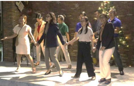
ការច្រៀងជាគ្រុមពីគ្រូឧទ្ទេសនៃ PTEC