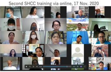
Second SHCC training via online, 17 Nov. 2020