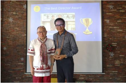
ពានរង្វាន់ SHCC ត្រូវបានប្រគល់ជូនគ្រូ ឧទ្ទេសទាំងអស់ ដោយបានផ្តល់កាបូបតូច មួយសម្រាប់ដឹកទឹករបស់គ្រូមេង SHCC។