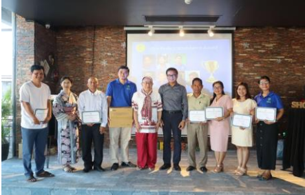
ពានរង្វាន់អ្នកចូលរួមវគ្គបណ្តុះបណ្តាលពេញលេញសម្រាប់គ្រូឧទ្ទេសទាំង ៧ នាក់!! ដូច្នេះ ហើយ SHCC បានផ្តល់រង្វាន់លើកទឹកចិត្តជា LCD Projector សម្រាប់ការប្រើប្រាស់សម្រាប់ ការបង្រៀនមុខវិជ្ជាសុខភាពសិក្សា ដោយសារតែគ្រូឧទ្ទេសនៅ BTEC មានចំនួន ៤នាក់!!