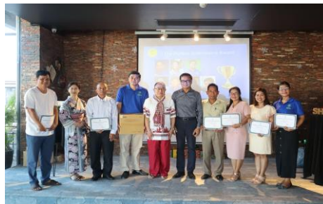
Perfect Attendance Award for 7 lecturers!! SHCC presented the LCD Projector as an incentive award for use in teaching Health classes to the BTEC team because 4 lecturers awarded it.