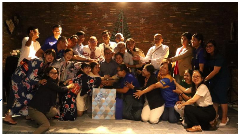
Full of LOVE in all SHCC members