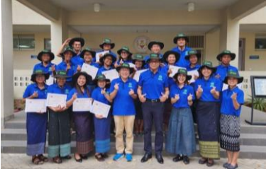
មានស្នាមញញឹមនៅវគ្គបណ្តុះបណ្តាលផ្ទាល់