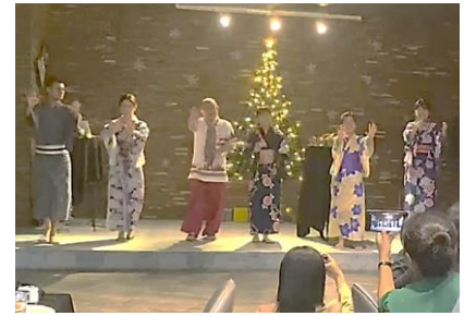
Japanese Traditional Dance by SHCC Teams