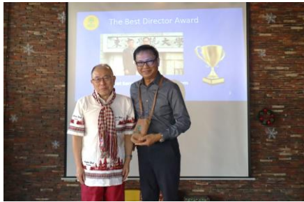
SHCC award was presented to all lecturers by giving a small bag for SHCC tumbler.