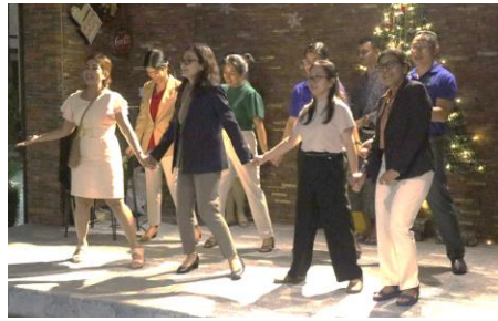
A chorus from PTEC lecturers