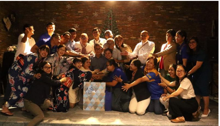
ពោរពេញដោយក្តីស្រឡាញ់នៅក្នុងចំណោមសមាជិក SHCC ទាំងអស់