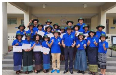
Smile in physical training