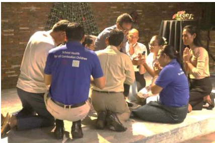
ការជូនពរពីគ្រូឧទ្ទេសនៃ BTEC