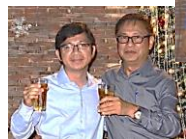
Strong bond between BTEC and PTEC