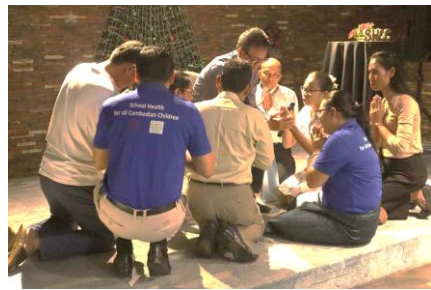
Blessing from BTEC lecturers