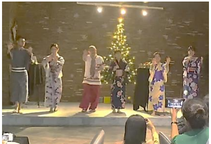
ការរាំបាំជំនុំដោយសមាជិកគម្រោង SHCC